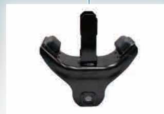
▶ Cushion Rubber