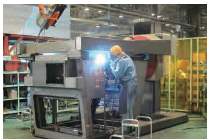
▶ 溶接ボジショナー