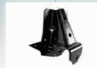
▶ RR Spring FT