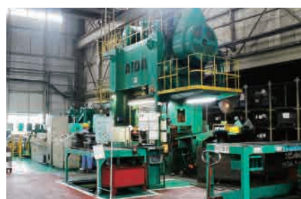
▶ 400トン メカニカルプレス