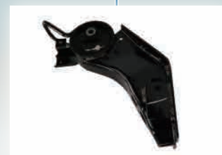
▶ Cab Mtg