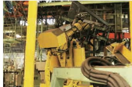
▶ ハンドリングロボット