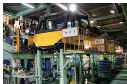
▶ 上下同時作業用ステージ