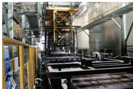
▶ カチオン電着塗装