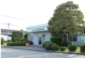
真岡工場 Moka Plant

主要取引先 IHI建機株式会社、株式会社アイメタルテクノロジー いすゞ自動車株式会社、株式会社加藤製作所 株式会社小松製作所 キャタピラージャパン株式会社 酒井重工業株式会社、自動車部品工業株式会社 日立建機株式会社、古河ロックドリル株式会社 プレス工業株式会社、三菱重工業株式会社 UDトラックス株式会社（50音順、敬称省略）