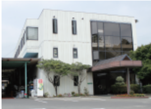
小山工場 Oyama Plant