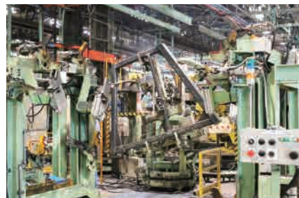
▶ アーク溶接ロボット