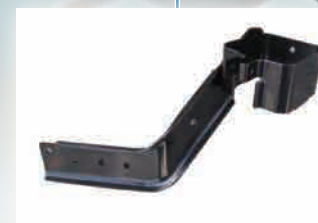
▶ P/STRG Oil Tank