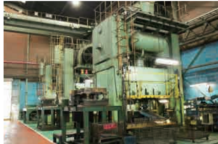
▶ 500トン メカニカルプレス