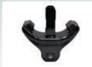
▶ Cushion Rubber