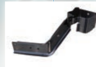
▶ P/STRG Oil Tank