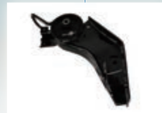
▶ Cab Mtg