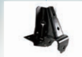
▶ RR Spring FT