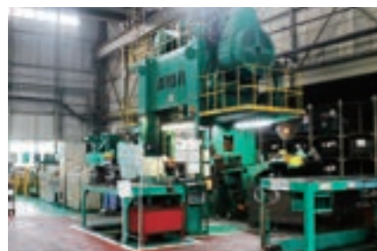
▶ 400トン メカニカルプレス