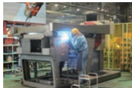
▶ 溶接ポジショナー