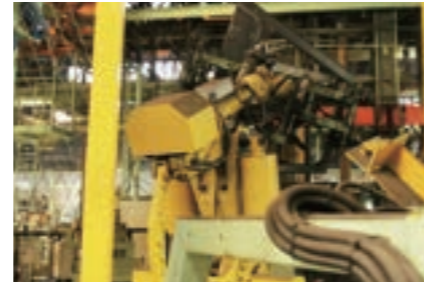
▶ ハンドリングロボット