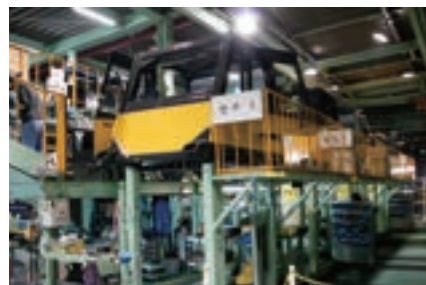
▶ 上下同時作業用ステージ