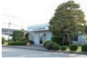
真岡工場 Moka Plant