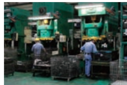
▶ 200トン メカニカルプレス