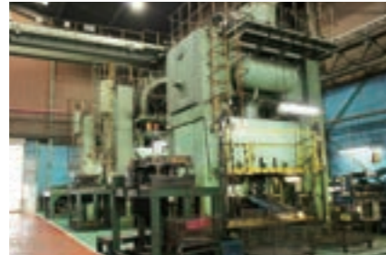
▶ 500トン メカニカルプレス