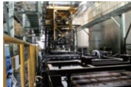
▶ カチオン電着塗装