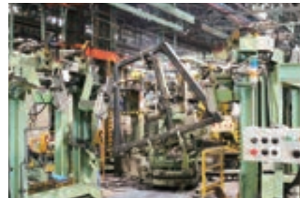
▶ アーク溶接ロボット