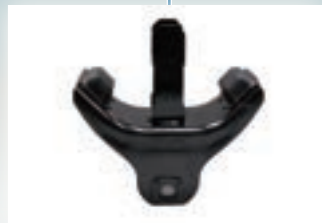
▶ Cushion Rubber