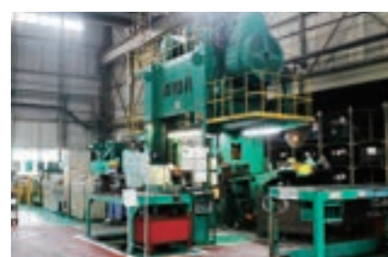
▶ 400トン メカニカルプレス